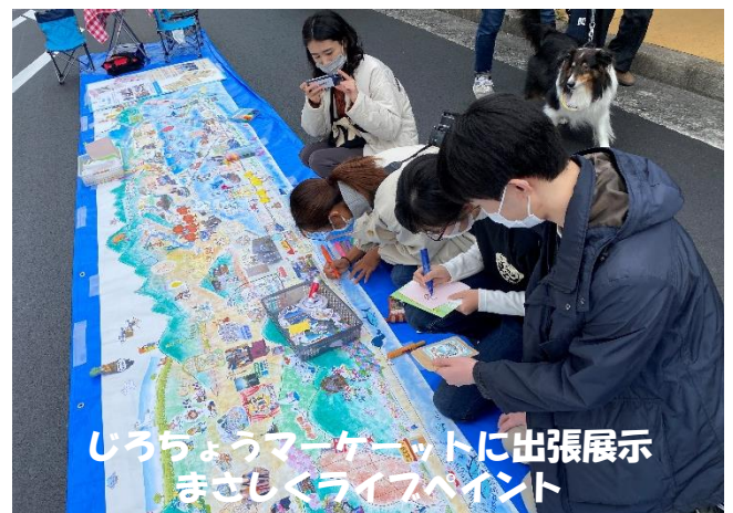
じろちょうマーケットに出張展示 まさしくライブペイント