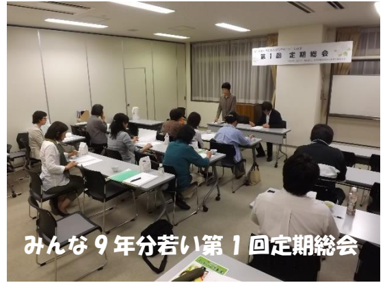
みんな 9 年分若い第 1 回定期総会

自分たちの活動を検証し今後の方向性について再検討をする場とするために、会員のみなさんからの忌憚のないご意見をお待ちしています。