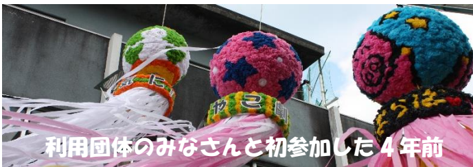
利用団体のみなさんと初参加した 4 年前

コロナ禍により 2 年続けて中止となった清水七夕まつり。今年は駅前銀座商店街を中心に開催されることになりました。